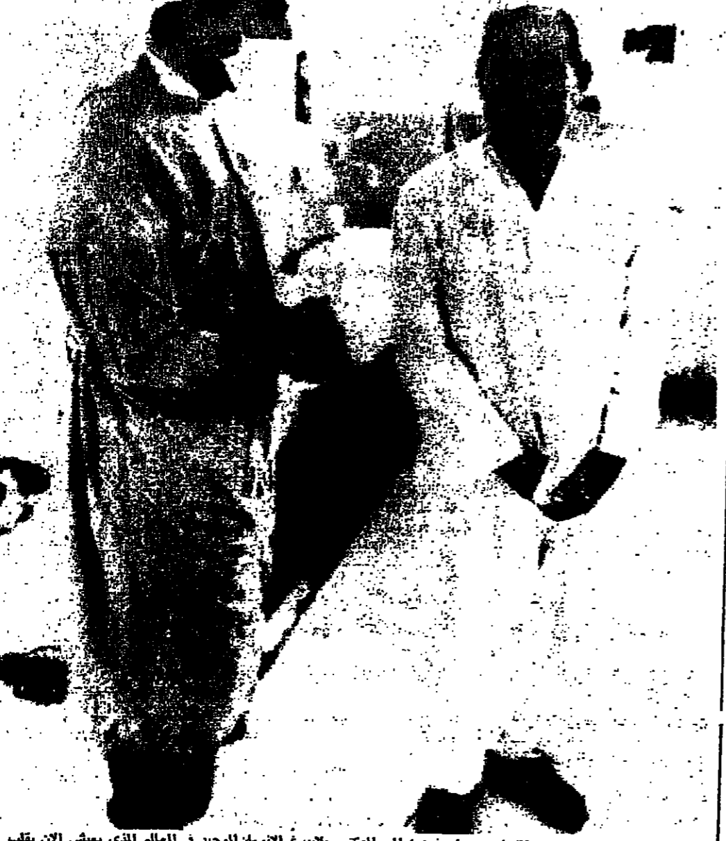
الدكتور بارنارد يبحث (اليمين) مع الدكتور بلايرغ الانسان الوحيد في العالم الذي يعيش الان بقلب مزدوج وقد صرح الدكتور برنارد ان مرضه سيحارب الدكتور بيلارد ان اسويجين